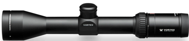
2.5 - 10 x 44 (VHS-4303)

Leveres med beskyttelsesdæksler, solskygge/dugkappe, CRS stop og klud af mikrofiber.