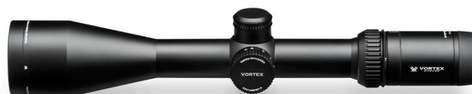
4 - 16 x 50 (VHS-4307)