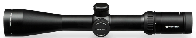
4 - 16 x 44 (VHS-4305)